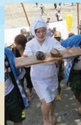
しろんご祭り (鳥羽市菅島)