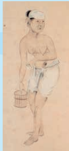
明治初期以前の海女

上半身はだかで腰に布を巻いた時代を経て、海女は寒さを防ぐため、1960年ころからウエットスーツを着るようになりました。ウエットスーツを着ると身体が浮くので、腰に5～8キログラムの重り付きのベルトを巻きます。