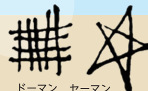
ドーマン セーマン

「ドーマン」(修験道の呪符・九字)と「セーマン」(一筆書きの星印)は志摩半島の海女が身に付ける独特の魔除けのマーク。