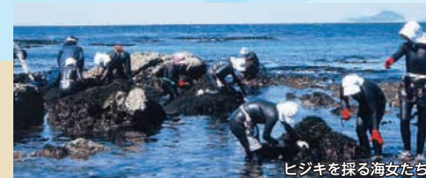
ヒジキを採る海女たち