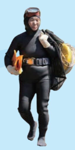
ウエットスーツを着た最近の海女

海女の道具で大切なのは、水中が良く見え、獲物を見つけるのに必要な磯メガネ、そしてアワビを岩から剥がすイソノミです。イソノミには何種類もあります。とった獲物を入れておく以前の磯桶は、戦後には、タンポに変わりました。網袋を吊るした浮き輪で、浮上した海女の短い休憩を助けます。海女の身体とタンポを繋ぐイノチズナ（命綱）も大切な道具の一つです。その他にもイソテヌグイや足ヒレなどがあります。