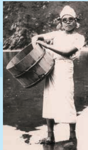
明治末から昭和初期の海女