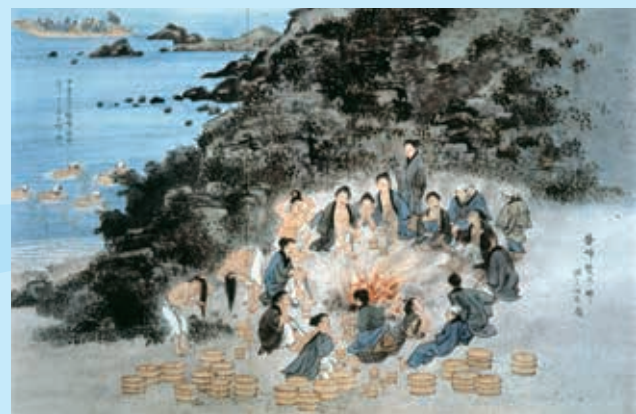
三重県水産図解 (明治 16年 / 1883年) 焚火で暖をとる海女が描かれている。