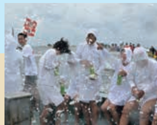
潮かけ祭り (志摩市和具大島)