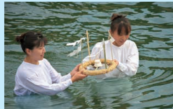
浜祭り (志摩市布施田)

海女は漁期のはじめや途中で、海の神様に大漁や操業の安全を願って、おまつりをします。なんといっても海女の一番の願いは大漁ですが、たくさんの獲物をもたらしてくれる自然の海は、いつも静かで優しいとは限りません。海には危険な魔物も多くひそんでいると海女は考え、神様に助けを求め、潜水作業の無事を願います。